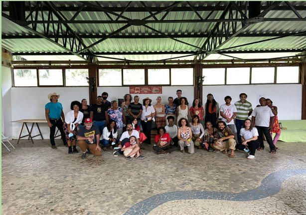
Encontro das turmas do curso CaipiratechLAB

Nos dias 21 e 22 de janeiro aconteceu um encontro muito especial, que reuniu as turmas dos últimos três anos de cursos do programa CaipiratechLAB, como uma forma de fazer articulações, conversas e celebrar a agricultura.