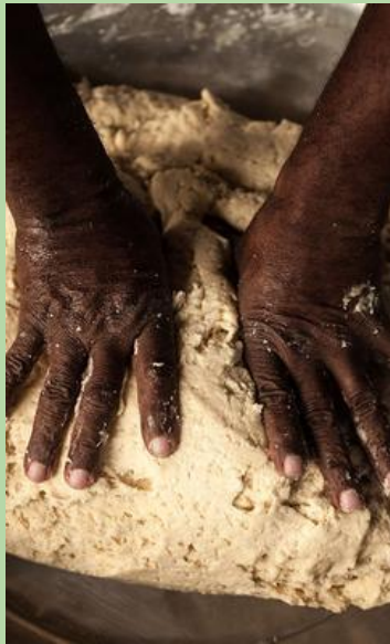
Imagem do artigo citado ao lado

Cinthia postou um conjunto de artigos da Cátedra Josué de Castro de Sistemas Alimentares Saudáveis e Sustentáveis. Selecionamos trechos de dois deles: